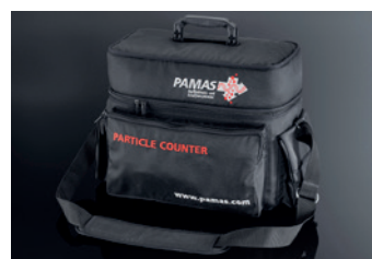
Sac à bandoulière PAMAS GO

Le sac à bandoulière sur mesure offre un espace supplémentaire pour les accessoires.