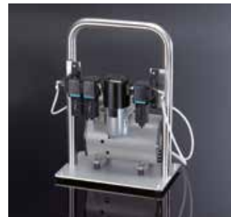
Externe Pumpe mit Filter- und Trocknungseinheit für die Druckluft- und Vakuumsversorgung des Geräts