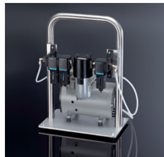
Externe Pumpe mit Filter- und Trocknungseinheit für die Druckluft- und Vakuumversorgung des Geräts