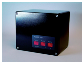
PAMAS S50P avec pompe intégrée pour installation sans pression

Si l'installation fournit la pression, l'appareil peut fonctionner sans pompe interne. PAMAS S50 détermine en continu le débit à travers le capteur pour atteindre des résultats précis de mesures indépendamment de la pression d'entrée. Le débit variable est compris entre 5 et 50 ml/min. Pour des installations sans pression, PAMAS S50 peut être équipé d'une pompe ( PAMAS S50 P ). La pompe doseuse, avec piston et cylindre en céramique, résistant à l'usure, contrôle le débit à 25 ml/min pour une pression de 0 à 7 bar.