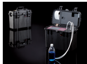
Robusta carcasa PAMAS GO

Todas as versões estão disponíveis em design robusto PAMAS GO, de forma opcional.