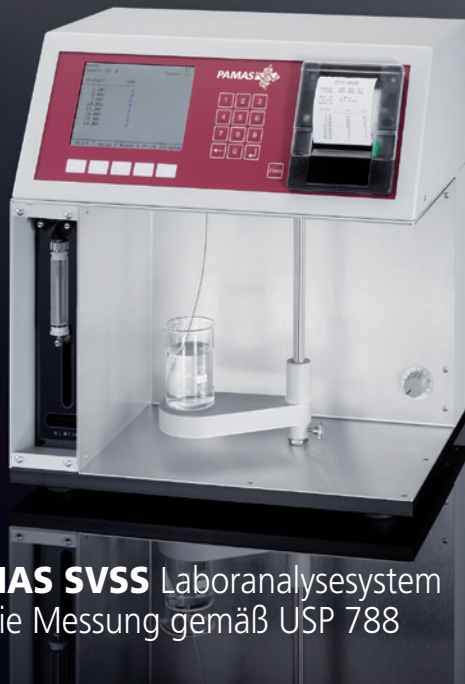
PAMAS SVSS Laboranalysesystem für die Messung gemäß USP 788