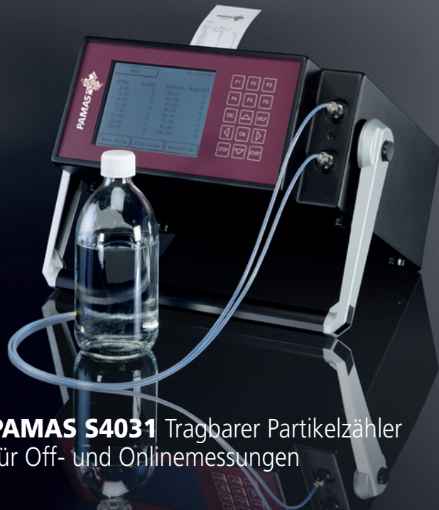
PAMAS S4031 Tragbarer Partikelzähler für Off- und Onlinemessungen