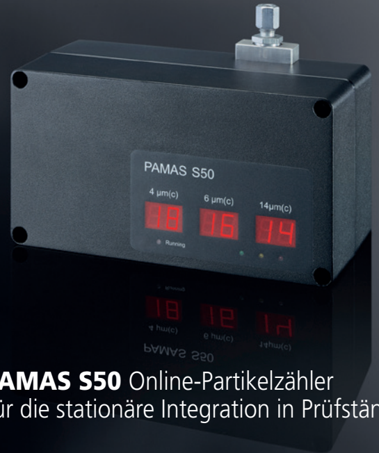
PAMAS S50 Online-Partikelzähler für die stationäre Integration in Prüfständen