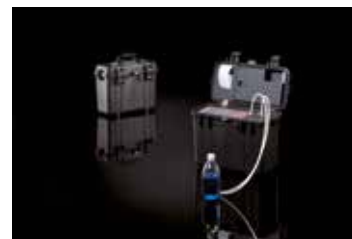
Robustes Gehäuse PAMAS GO

Alle Modellvarianten sind optional im robusten Gehäuse PAMAS GO erhältlich.