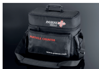
Sac à bandoulière PAMAS GO

pour les fluides hydrauliques à base du mélange eau glycol, l'eau douce, l'eau de mer et les produits chimiques