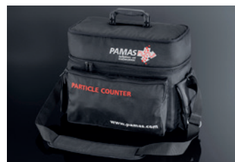
Schultertasche PAMAS GO

Die passgenaue Schultertasche bietet zusätzlich Platz für Zubehör.