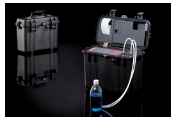
Robustes Gehäuse PAMAS GO

Alle Modellvarianten sind optional im robusten Gehäuse PAMAS GO erhältlich.