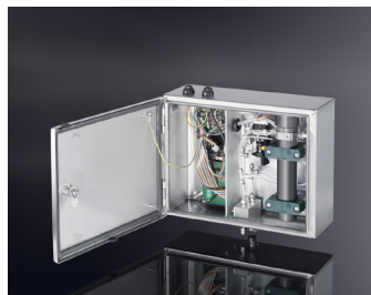
PAMAS OLS50P en coque d'acier affiné

Pour l'analyse des huiles hydrauliques à base d'ester de phosphates (p.ex. liquide hydraulique pour aviation), le PAMAS OLS50P est fabriqué avec une coque en acier inoxydable spécial qui protège le boîtier des liquides corrosifs.