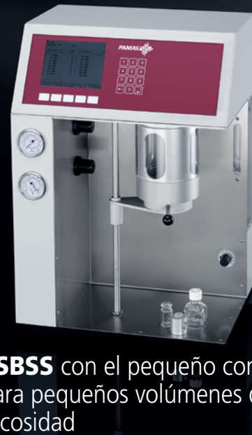
PAMAS SBSS con el pequeño contenedor de presión para pequeños volúmenes de fluidos de alta viscosidad