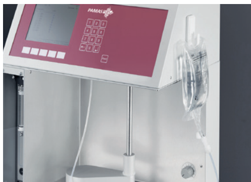
Accesorios para soluciones de infusión

Para el análisis de soluciones farmacéuticas poco viscosas, PAMAS ofrece el modelo SVSS, un versátil y altamente flexible contador de partículas. La altura ajustable de la toma de muestra permite el uso de una amplia variedad de recipientes y está equipado con un agitador magnético para garantizar que el fluido permanezca homogéneo. En unos pocos simples pasos, el SVSS se puede adaptar para la medición de volúmenes de muestra mas pequeños de hasta 100 µl. Para evitar decantaciones y volúmenes muertos, un kit especial que permite que las muestras salgan directamente de las bolsas, también está disponible bajo pedido.