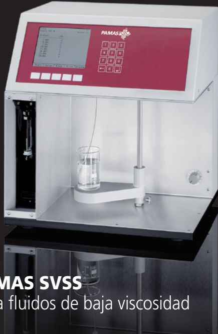
PAMAS SVSS para fluidos de baja viscosidad