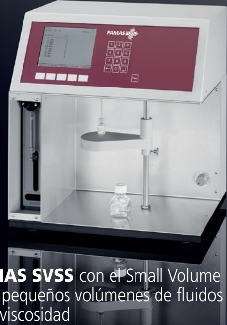
PAMAS SVSS con el Small Volume Kit para pequeños volúmenes de fluidos de baja viscosidad