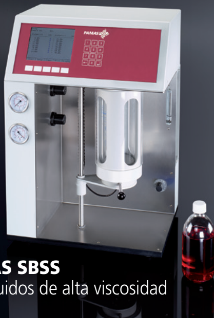
PAMAS SBSS para fluidos de alta viscosidad